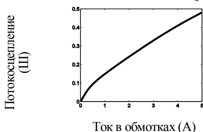
Рисунок 1 – Название рисунка

МАТЕРИАЛ И РЕЗУЛЬТАТЫ ИССЛЕДОВАНИЙ. Рисунки выполняются черно-белыми или в оттенках серого. Оси на графиках должны иметь поясняющее название (рис. 1).