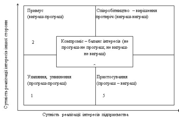
Рисунок 2 – Матриця способів реалізації інтересів взаємодіючих суб'єктів менеджменту

Виходячи з ситуацій, які можуть викликатися при взаємодії підприємства з суб'єктами його оточення, можна сформулювати основні об'єктивно можливі типи відносин у процесі взаємодії підприємства та суб'єктів оточення, які наведені в побудованій матриці (рис. 2) [8].