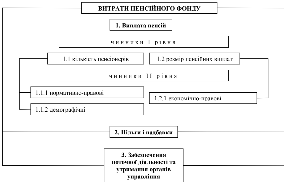
Рисунок 2 – Структурно-логічна факторна модель залежності величини витрат від впливу різних чинників

Враховуючи те, що найбільш вагомими витратами у загальних витратах Пенсійного фонду є витрати на виплату пенсій основну увагу під час дослідження приділимо саме цій складовій.